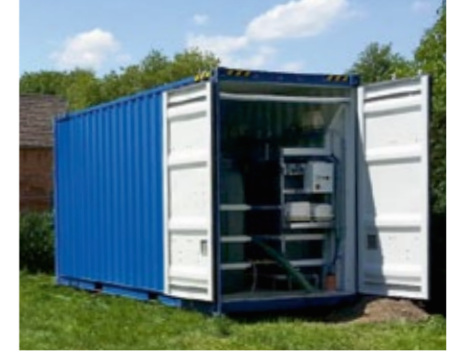
Konteynir çözümü: Su ve soğutma