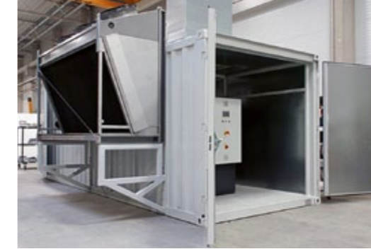
Konteynir çözümü: Elektrik, ısıtma ve soğutma