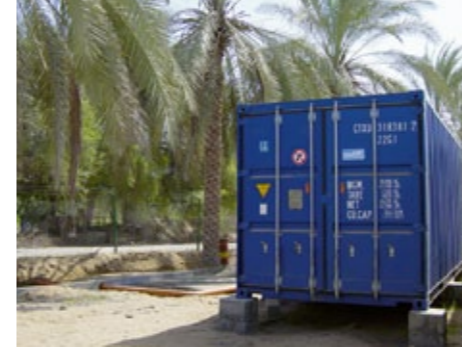
Umman'da su hazırlama konteyniri

Konteynir çözümleri üç ihtiyaç alanına taksim edilmektedir: Elektrik ve ısıtma / Soğutma / Su. Sahip olduğumuz "Alman Kalitesi"ndeki mühendislik tecrübesiyle konteynirlerinizi tam da sizin ihtiyaçlarınıza uygun olarak geliştirebilecek ve imal edebilecek yetenekteyiz.